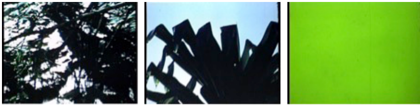
Hollis Frampton, Mindfalls VI, 1977- 1980, film 16 mm

l'espace au lieu de son expansion combinée au traitement du son spatialisé qui ancre de manière paradoxale cette a-topie à l'intérieur d'une réalité physique – tant d'éléments esthétiques mis en œuvre par les artistes qui interrogent le regard et la perception, mais aussi la nature même et le potentiel du médium de la réalité virtuelle.